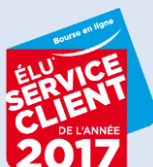
ÉLU SERVICE CLIENT DE L'ANNÉE*